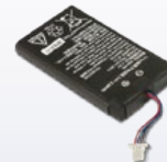
RBP-DBT6X RBP-6400 Pack de batteries remplaçables